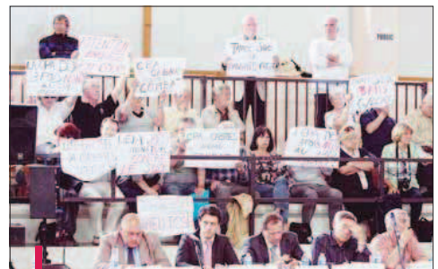
Les membres de l'ADSR ont manifesté leur hostilité au tracé sud pendant le conseil exceptionnel.

Malgré la motion adoptée par la CPA, le collectif de riverains de Cabriès croit toujours en son projet alternatif, le tracé "nord 2 vert".